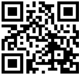
大会申込先QRコード

〒363-8509 埼玉県桶川市赤堀2-4 マルキュー(株)内 問い合わせメールアドレス：info@marukyufangroup.com TEL 048-728-0909 / FAX 048-728-3909 MFGホームページ：http://www.MarukyuFanGroup.com